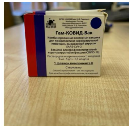
Component II (secondary packaging)

Paper box containing 5-dose vial for 3 ml