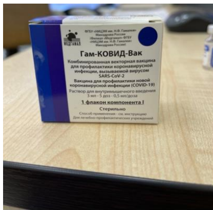
Component I (secondary packaging)

Paper box containing 5-dose vial for 3 ml