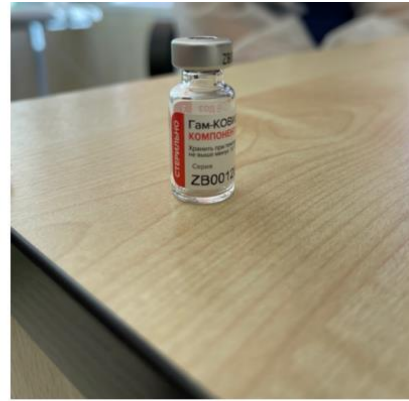
Component II (primary packaging)