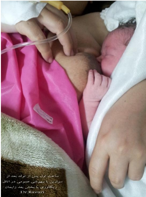
ساعت اول پس از تولد بعد از سزارین با بیهوشی عمومی در اتاق ریکاوری با بخش بعد زایمان Dr. Ravaei

۱. در اتاق عمل بلافاصله پس از تولد و انجام ساکشن دهان و بینی و قطع بند ناف، نوزاد را در حین بررسی نیاز به احیا خشک نموده و با یک حوله خشک و گرم دیگر سر و پشت او را بپوشانید و به نحوی در پهلوی مادر قرار دهید که بند ناف نوزاد جهت کلونیزه شدن) با پوست مادر در تماس